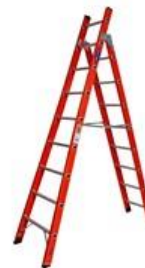
Multifuncional (Tesoura e Singela)