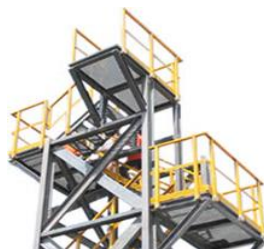
Estruturas, Plataformas e Guarda-Corpo