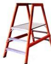
Plataforma de Trabalho