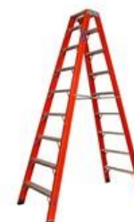
Tesoura Duplo Acesso